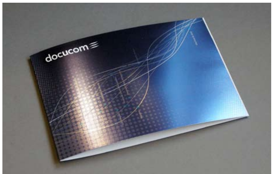
Veredelung mit Kaltfolientechnik ermöglicht alle möglichen Metallicfarben in einem Arbeitsgang.