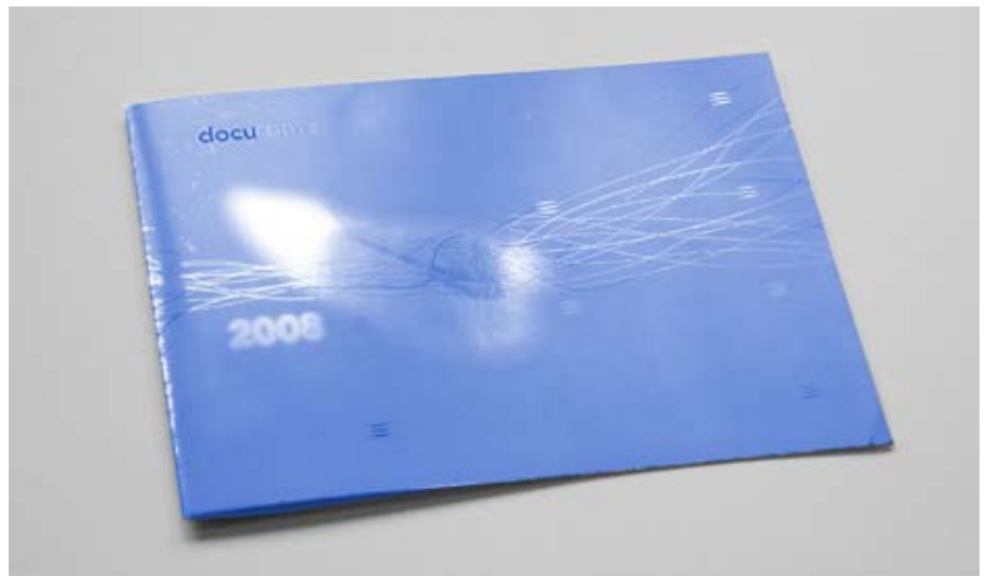
Diese Karte wurde digital auf chrombedampftes Papier gedruckt. Um den Glanzeffekt in den Linien und im Logo hervorzuheben, ist die weiße Grundierung nur partiell angelegt.