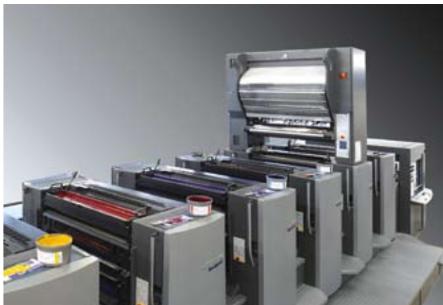
Bei dieser Heidelberg CD 102-6+LX2 der Druckerei Nastro&Nastro, Germignaga (I), werden für das Coldfoilverfahren zwei zusätzliche Werke gebraucht. Das erste Werk trägt den Klebstoff auf, im zweiten Werk wird die Metallfolie zugeführt, die an den mit Klebstoff versehenen Stellen haftet. Infos: www.nastroenastro.it

Eine Weihnachtskarte ist etwas Persönliches, also ist die Personalisierung, sprich Digitaldruck, fast Pflicht. Als Papier verwendeten wir das chrombedampfte Papier »Invercote Metalprint«, welches mit einer HP Indigo partiell weiß grundiert wurde. Gewisse Stellen bleiben ausgespart und glänzen silbern. Anstelle einer Heißfolienprägung konnte die Karte digital mit dem gleichen Effekt versehen und in der gleichen Maschine personalisiert werden.